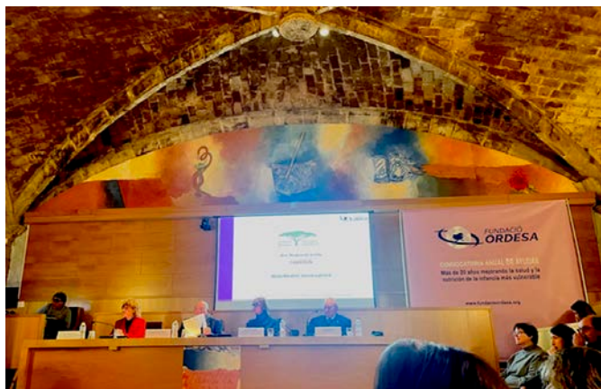
El lliurament d'ajudes de la Fundació Ordesa tingué lloc a la seu de la Reial Acadèmia de Farmàcia de Barcelona.

entre les quals la Fundació Sant Francesc Xavier de la Parròquia de Sant Ot; i, finalment, la Fundació Ordesa va repartir 5 tones d'aliments materno-infants a 15 entitats, una de les quals fou també la Llar d'Infants Francesc Xavier.