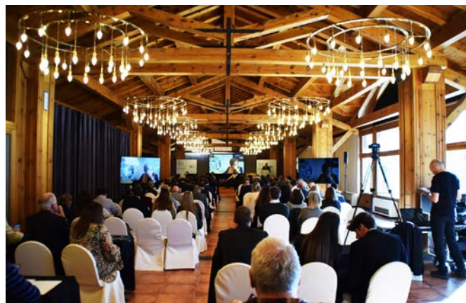
La trobada anual de l'Empresa Familiar Andorrana va registrar una important participació d'empreses andorranes i de representants polítics i institucionals.