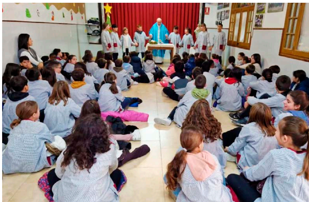
En la festa de la Immaculada Concepció, els alumnes de primària del col·legi Mare de Déu del Socós van compartir una celebració preparada per l'equip de pastoral del centre.

Després de missa, tot sortint a l'hora d'esbarjo, coca i xocolata per a tothom, com no podia faltar en una festa de celebració.