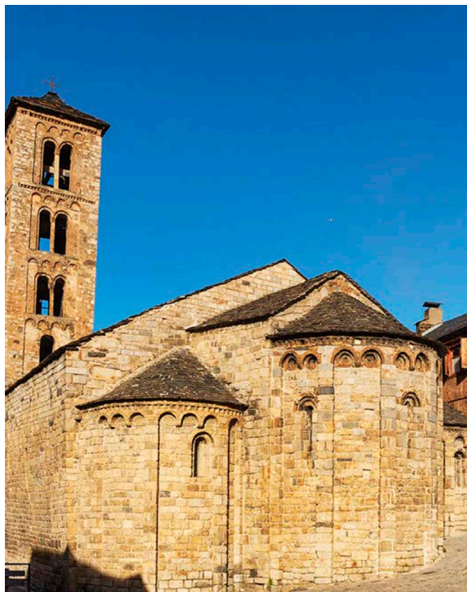
El 10 de desembre de l'any 1123, el Bisbe de Roda d'Isàvena, Sant Ramon Guillem, consagrà l'església de Sant Climent de Taüll (esquerra) i l'endemà consagrà l'església de Santa Maria de Taüll.