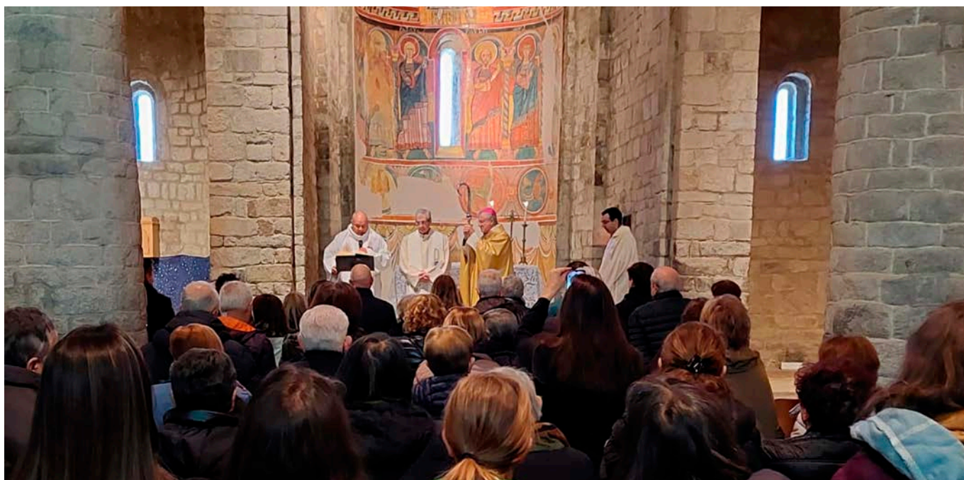
L'Arquebisbe d'Urgell presidí a Santa Maria de Taüll la solemne Eucaristia amb motiu dels 900 anys de la consagració del temple.

i la solitud de les persones malgrat la gran intensitat comunicativa als mitjans digitals.