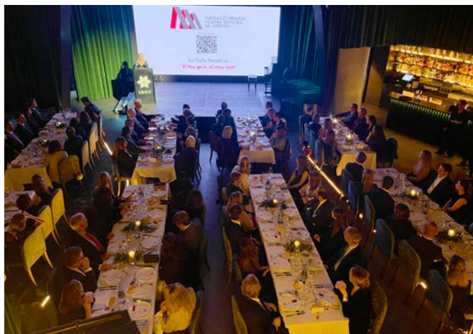
Un centenar de persones assistí a la primera gala benèfica de la Fundació Privada Nostra Senyora de Meritxell.