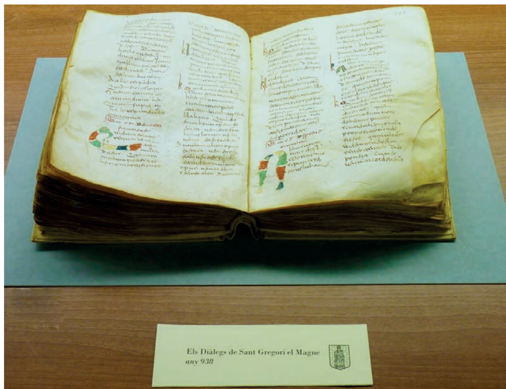
Els Diàlegs de Sant Gregori el Magne any 938

A dalt, "Els diàlegs de Sant Gregori el Magne" (any 938). A sota, pergamí de l'any 815 on es consigna la compra d'un terreny en el qual poc temps després bastiren el monestir de Sant Climent de Codinet.