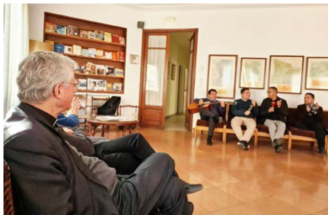
Mons. Vives, acompanyat del Rector i el Vicerector del SMI, va conversar amb els seminaristes sobre la trobada amb el Sant Pare el passat novembre.

El 21 de desembre, l'Arquebisbe d'Urgell i Bisbe delegat per al Seminari Major Interdiocesà de Catalunya (SMI) va visitar els formadors i seminaristes