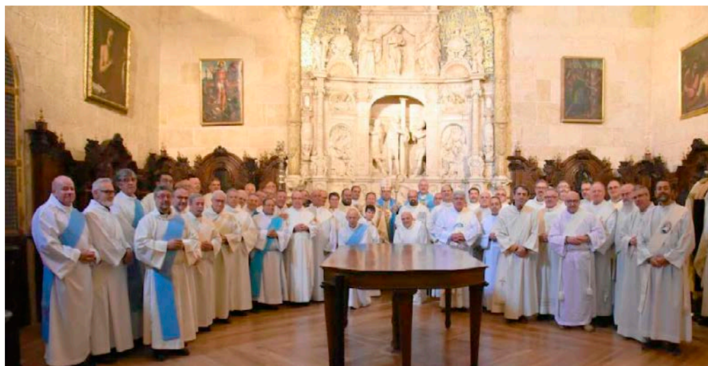
Els diaques permanents de les Diòcesis espanyoles celebraren a Àvila la seva trobada anual.