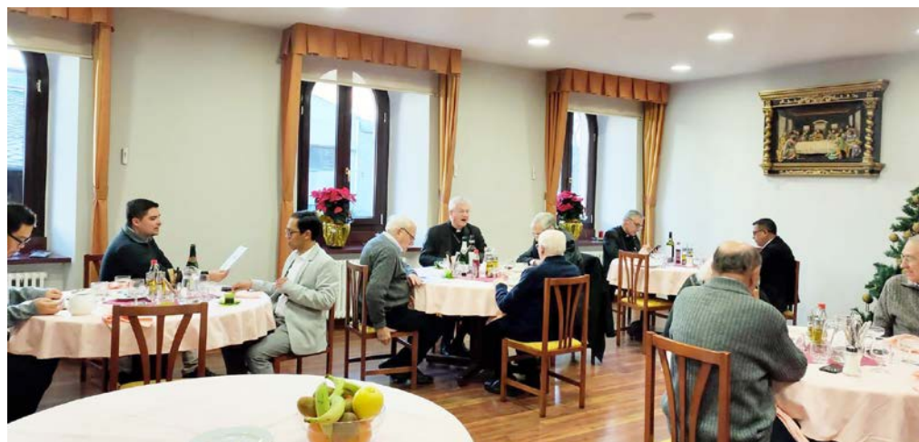
Els sacerdots de la Residència Sant Ermengol van reunir-se el 23 de desembre amb l'Arquebisbe per celebrar plegats el Nadal.