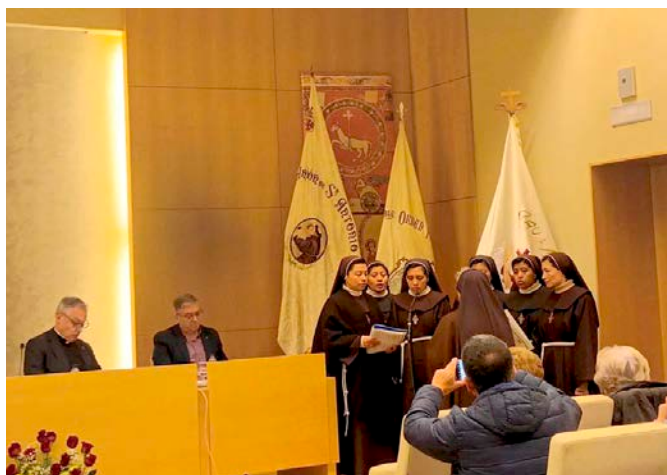
La casa d'espiritualitat del Sant Crist de Balaguer acollí un acte commemoratiu del vuitè centenari del primer pessebre.

món”, de Georg Friedrich Händel (1685–1759), i “ Dadme albricias hijos de Eva ”, composició del segle XVI d'autor anònim.