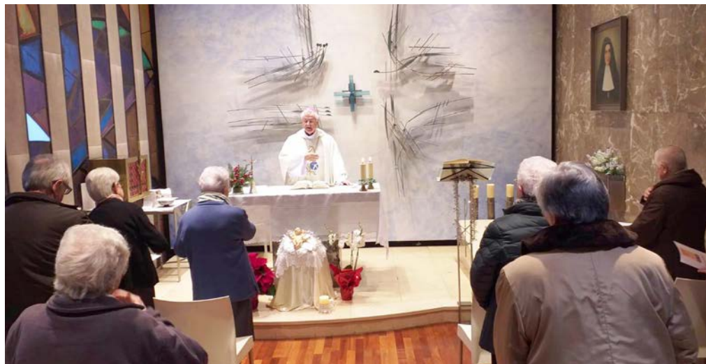
L'Arquebisbe d'Urgell va presidir l'Eucaristia de la Festa de la Sagrada Família prop del sepulcre de la beata Anna Maria Janer.

vivint els vots de castedat, pobresa i obediència, segons les Constitucions de l'Institut de Germanes de la Sagrada Família d'Urgell. Confio en la gràcia de Déu, que demano per intercessió de la Sagrada Família, i en l'ajut de les meves germanes, per ser fidel a la meva consagració".