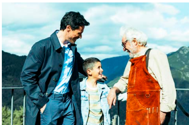
Un fotograma del curtmetratge "Tirites".

drones de esperanza ", adreçat als alumnes de segon cicle de secundària i batxillerat.