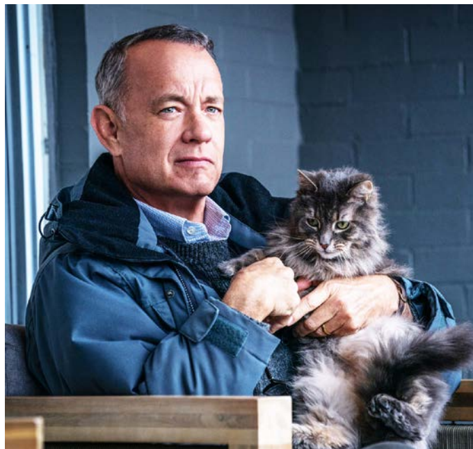
La pel·lícula d'animació "Belle" (a l'esquerra, a dalt) encetà la programació de la Setmana de Cinema Espiritual d'enguany. A sota, un fotograma de "Belfast". A la dreta, Tom Hanks interpreta el paper protagonista d'"El peor vecino del mundo".