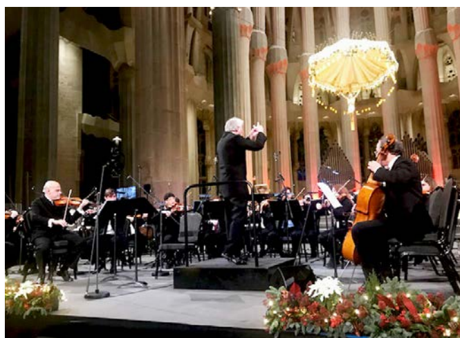
La Basílica de la Sagrada Família de Barcelona acollí el concert de celebració dels 75 anys de la Fundació Blanquerna.

La Basílica de la Sagrada Família de Barcelona acollí el 15 de desembre el concert de celebració