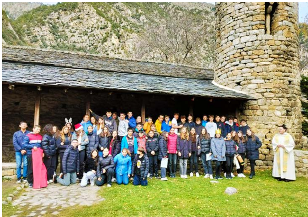
Els alumnes de secundària del col·legi Mare Janer van celebrar el Nadal a l'església de Santa Coloma.

El 22 de desembre, la Casa del Bisbat va acollir la tradicional felicitació de la Cúria diocesana a l'Arquebisbe d'Urgell, tot