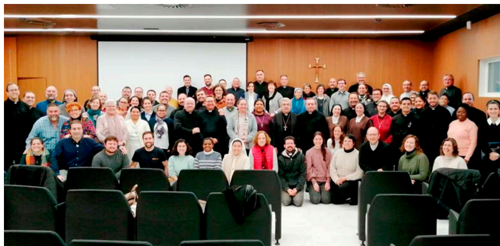
Fotografia de grup dels Delegats i equips de Pastoral Vocacional reunits a Madrid.