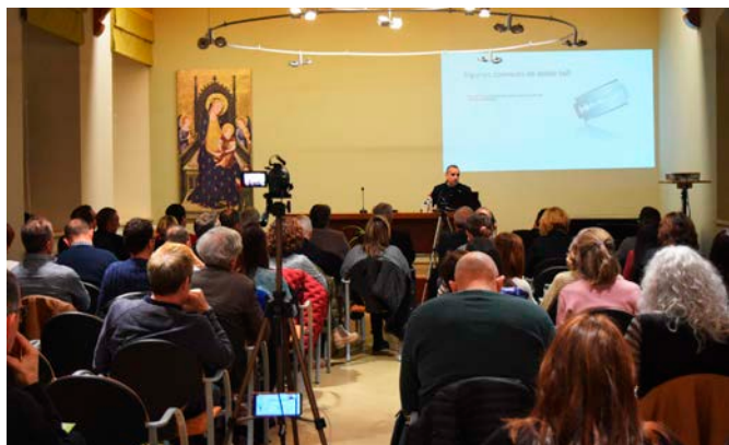
Les Jornades de reflexió educativa a La Seu d'Urgell i Andorra es van centrar enguany en el tema "Desmitifiquem la intel·ligència artificial (IA) en l'educació: entre alarmes i realitats".