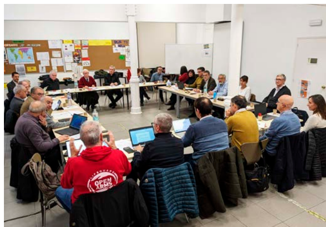
Entre d'altres temes, a l'Assemblea de Càritas Catalunya es va presentar la proposta del Pla de Voluntariat per al període 2024-2029.

Per acabar, es va lliurar als assistents un exemplar de la publicació "Càritas Catalunya als mitjans de comunicació de l'Església", editat dins la col·lecció "Dossiers"; i amb la pregària de l'Avemaria i la mirada a la Mare de Déu de Montserrat es va cloure l'Assemblea.