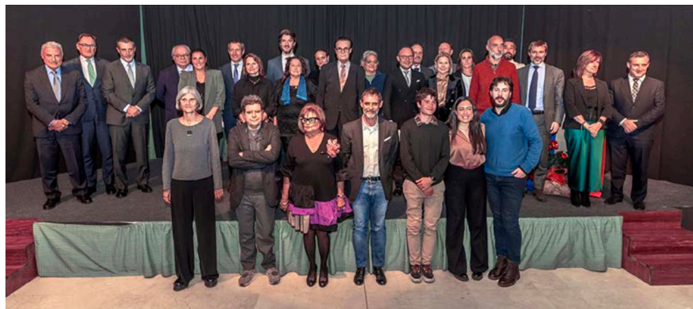
Autoritats i guardonats a la Nit Literària d’Andorra van posar junts al final de la vetllada.

En primer lloc s’atorgaren ajudes per a infraestructures per un valor de 40.000 euros a les institucions Activa Àfrica, Misiones Salesianas, Fundació Recover, Farmamundi i Asociación Moviendo Corazones. A continuació, es van concedir ajudes de 5.000 euros a 26 entitats de tot el territori espanyol,