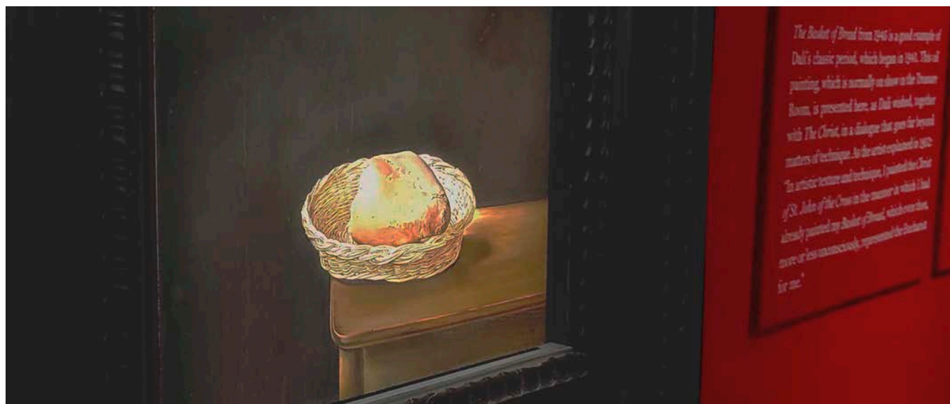
"La cistella de pa" complementa l'exposició que es pot veure al Teatre-Museu Dalí de Figueres fins al 30 d'abril vinent.

Dalí volia anar més enllà del relat dels sinòptics de Marc, Mateu i Lluc, i també del text evangèlic de Joan, i ens regala una nova teofania que crida amb llum i esperança damunt del món i la humanitat. Una teofania que s'entén per la disposició del Crist: aquí el veiem des de la posició que ell va veure en el petit dibuix del reliquiari d'Àvila, des de dalt. La teologia de la salvació que ens ofereix la pintura i el seu autor ens aporta una altra mirada; ara és Déu Pare que