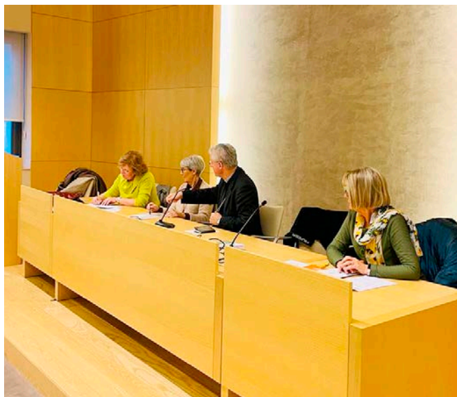
L'assemblea de l'Hospitalitat aprovà el balanç econòmic de l'entitat.

El dinar de germanor a l'Hotel del Santuari del Sant Crist de Balaguer va cloure aquesta joiosa trobada de l'Hospitalitat.