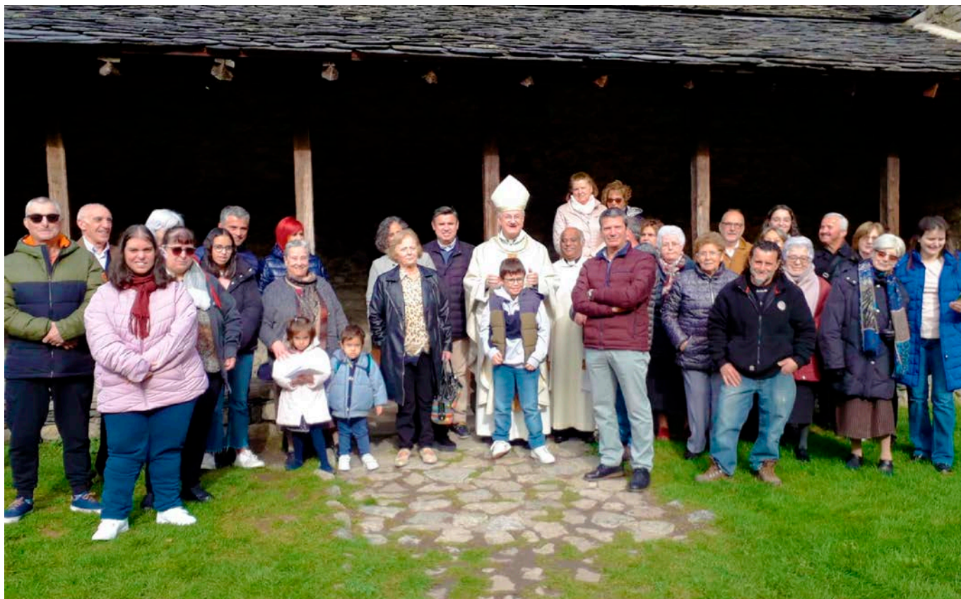
L'Arquebisbe i Copríncep començà la Visita Pastoral amb una celebració eucarística a l'església de Santa Coloma l'1 de novembre, i el darrer dia del mes presidí una sessió extraordinària al Comú de la Parròquia (a la pàgina següent).

També explicà el sentit de les visites dels apòstols i els seus successors, els Bisbes, valorant l'encontre dels fidels amb el pastor, que ens ha de donar esperança i unitat en aquests moments difícils que ens toquen de viure, amb