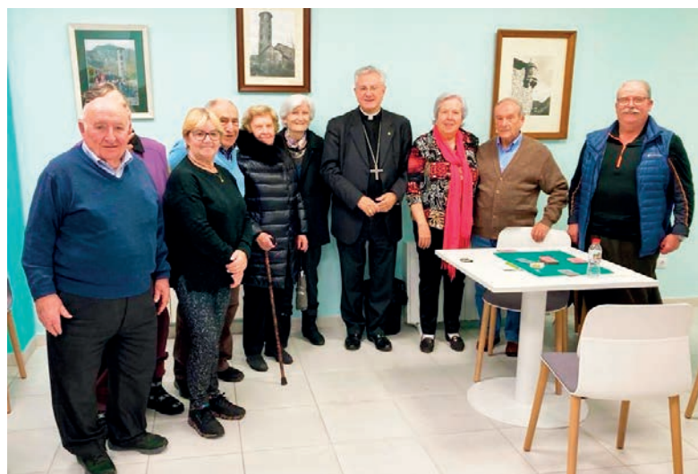
Durant la Visita Pastoral, Mons. Vives també tingué ocasió de conèixer de primera mà diverses institucions socials de la Parròquia, entre les quals la Fundació Privada nostra Senyora de Meritxell (a dalt a l'esquerra), la residència d'ancians El Cedre (a la dreta), la Clínica Sant Vicenç d'Enclar (a sota a l'esquerra) i la Casa Pairal de Santa Coloma

Parròquia i els membres del Comú a la Casa Pairal.