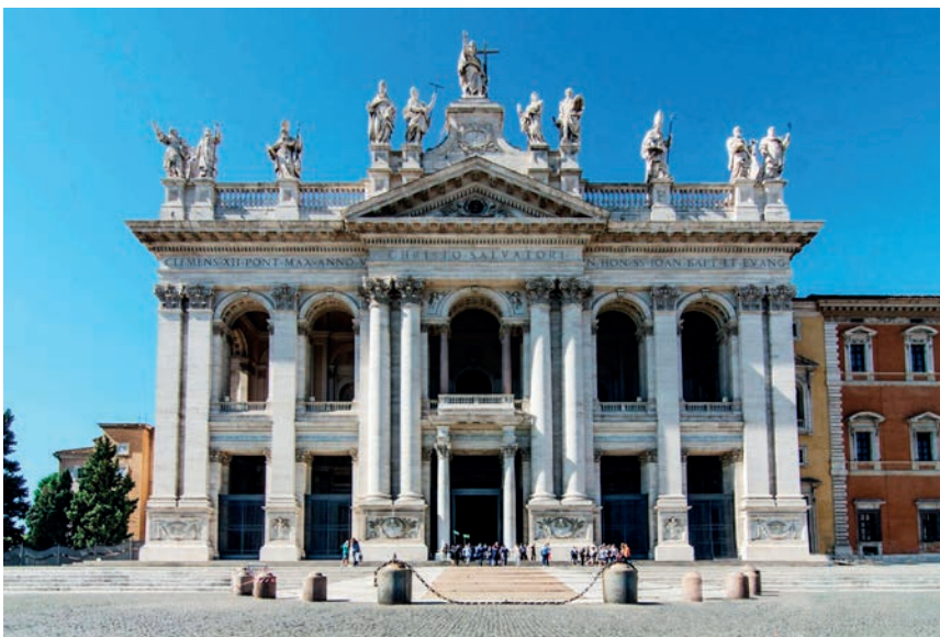
Façana principal de la Basílica de Sant Joan del Laterà, coronada per la imatge de Crist Salvador.

Aquesta Catedral de Roma, és un punt de referència molt especial per