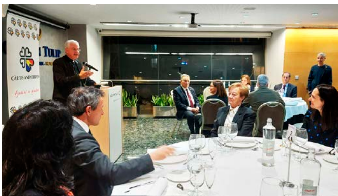
Al sopar solidari de Càritas Andorrana, l'Arquebisbe va demanar als assistents que "ens ajudeu a ajudar" l'entitat.

assistents que "ens ajudeu a ajudar" l'entitat.