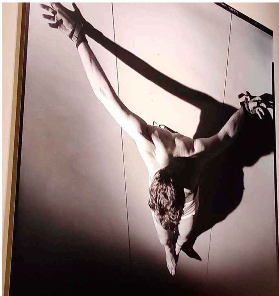
A l'exposició també s'inclou un retrat de l'actor californià Russ Saunders, que va posar com a model per a "El Crist de Portlligat".

mira vers els homes a través del Fill, i així, com diu bellament el poema de Santa Teresa de Jesús citat al principi d'aquest article, Jesús converteix la creu en el camí més segur de l'home cap al cel.