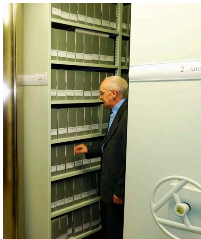
El 2014 es va inaugurar a l'antiga església dels Dolors la nova seu dels Arxius del Bisbat d'Urgell, amb unes instal·lacions de primer ordre tant en relació amb la seguretat com pel que fa a la conservació del fons documental.

tota la documentació generada, sinó que per diverses raons alguna part d'ella s'ha perdut. L'Arxiu comença amb una molt poca documentació de finals del segle XIII. Hi ha un buit i continua amb una sèrie de volums enquadernats, que s'inicien a finals del segle XIV. D'entre les diverses sèries, pròpies del règim del Bisbat, posarem de relleu el Registre de Cúria , on es reflecteixen les intervencions i actuacions del Bisbe i de la seva Cúria en relació amb les diverses esglésies de la Diòcesi. També és força notable la sèrie de Les visites de les esglésies . El Concili de Trento manà que els Bisbes havien d'establir unes visites periòdiques a cadascuna de les esglésies. Descriuen l'estat en què es troben les esglésies, tot assenyalant, en forma de manaments, les reformes que cal fer-hi. També sovint es parla de les institucions que hi pogués haver en una església o de l'actitud que adoptaven els seus rectors en el compliment dels seus deures.