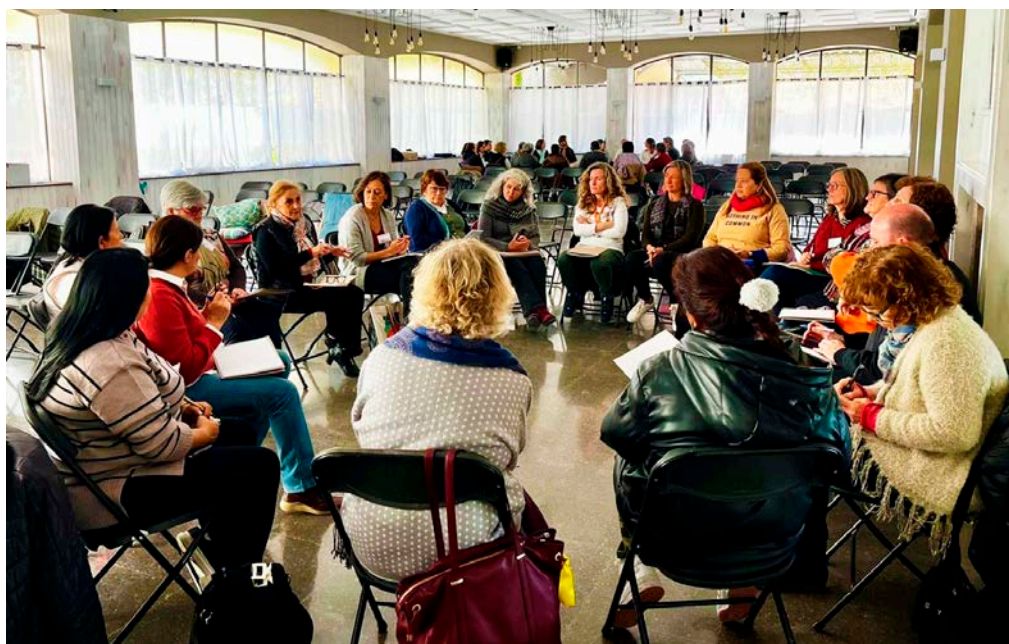
Durant les Jornades, els catequistes s'organitzaren en grups de treball sobre els temes de les diferents ponències.