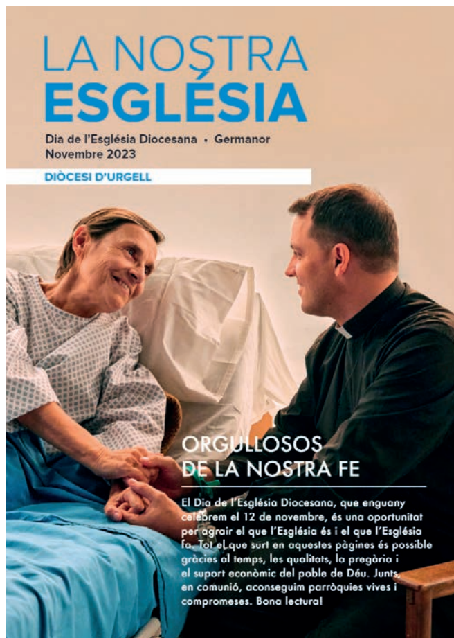
Cartell de la Campanya de Germanor d'enguany.

finançament seria el 0,7% del que es recull a través de les declaracions de la renda i per a aquells que lliurement marquin la casella corresponent en la seva declaració. Amb aquest sistema de col·laboració, l'Estat permet que les persones que volen ajudar l'Església Catòlica ho puguin fer, marcant la x, a través de l'assignació tributària. No és cap aportació