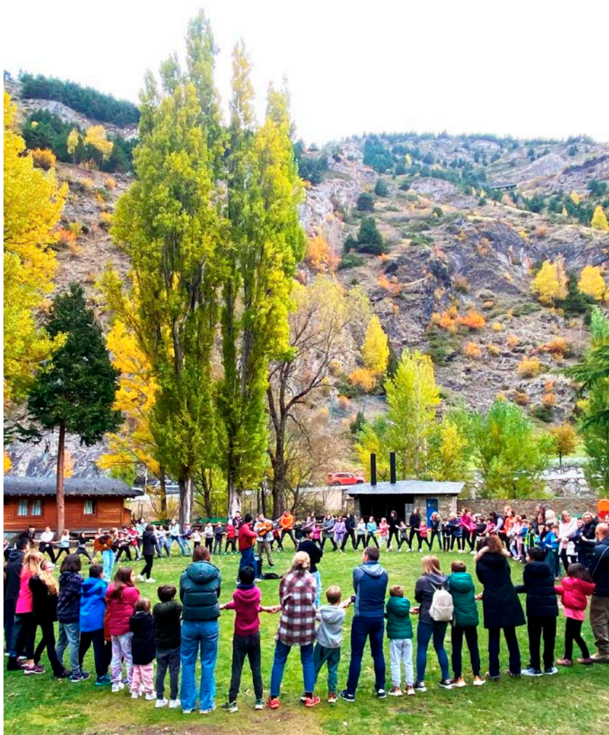
Les primeres neus al cim del Casamanya van tenir la natura de Canillo amb els colors de la tardor.