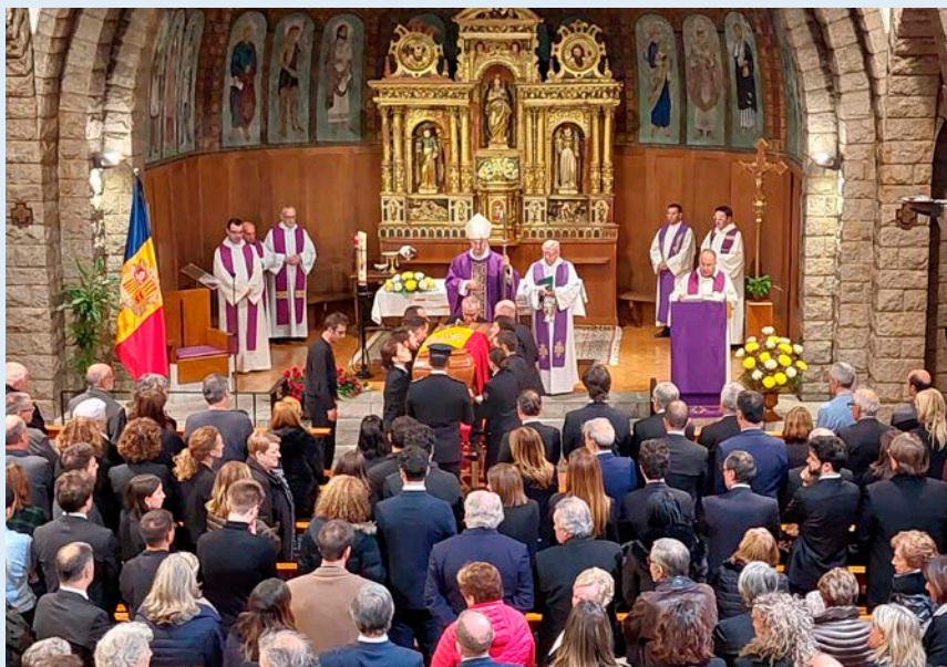
Multitud de fidels es van aplegar a l'església de Sant Pere Màrtir d'Escaldes-Engordany per sumar-se al darrer adeu a l'Antoni Martí Petit.

Li devem la culminació del procés de transformació, d'homologació i de transparència internacional d'Andorra. Va signar l'acord monetari, va completar el marc fiscal, va reformar l'Administració pública i va implementar el procés d'aproximació a la Unió Europea, fent d'Andorra un Estat cooperador, avançat i modern.