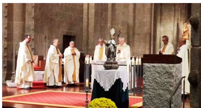
L'Arquebisbe d'Urgell i el Capítol Catedral van concelebrar la solemne Eucaristia en la festa de Sant Ermengol.

Al migdia els Canonges van celebrar un Capítol extraordinari, i després van compartir amb l'Arquebisbe el tradicional àpat festiu de Sant Ermengol, que en aquesta ocasió es va fer al Seminari de La Seu d'Urgell, amb la sobretaula amenitzada amb l'acordió