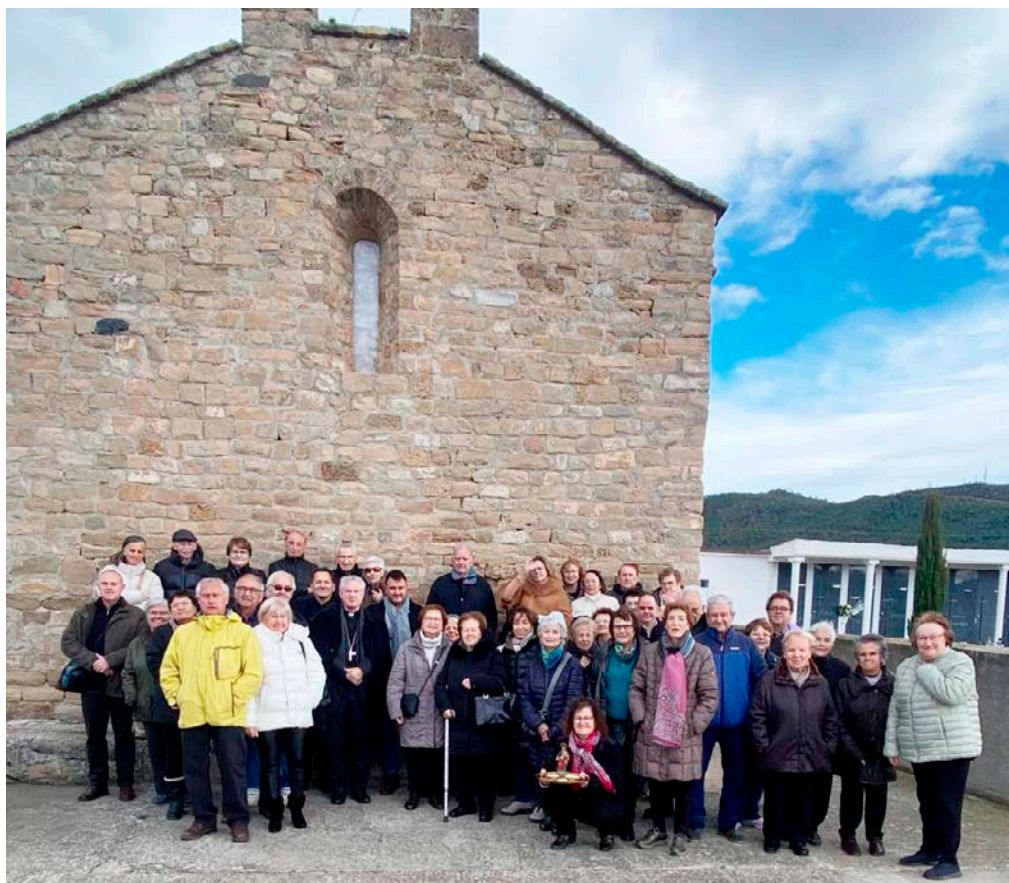
Un bon nombre de veïns de Peramola i de pobles propers van celebrar la festa de Santa Llúcia a l’església parroquial de Santa Maria de Tragó i Nuncarga.

Demanà pregàries per la transmissió de la fe als infants i joves, per la pau al món, i perquè ens sigui donada la pluja que ens durà prosperitat i fecunditat als camps; i felicità les Piores que ajuden molt el Rector en les tasques quotidianes i a mantenir l’esplendor del culte i la música a la Parròquia.