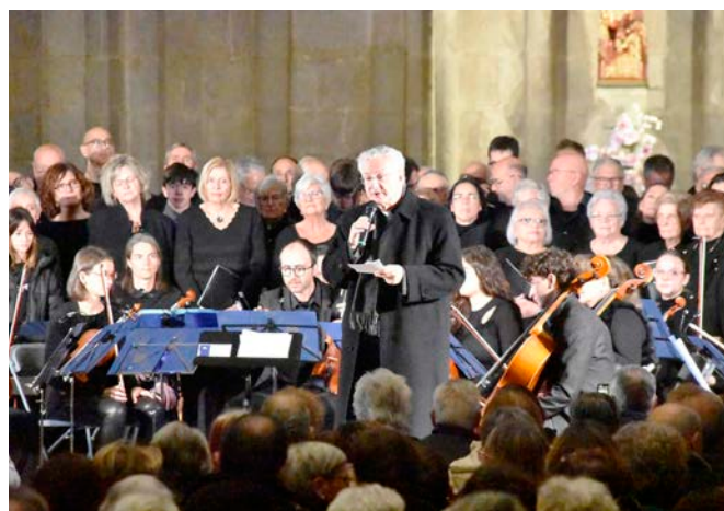
El concert solidari a favor del Taller Claror i Càritas d'Urgell aplegà a la Catedral prop d'un centenar de cantaires, acompanyats per l'Orquestra de Cambra Cadí.

El concert va aplegar per primera vegada totes les corals de la ciutat (Caterua, Encoratjades, Esplai de la Gent Gran, cors jove i adult de l'Escola Municipal de Música i Conservatori de Música dels Pirineus, Signum i Veus de la Seu), acompanyats pels músics de l'Orquestra de Cambra Cadí, dirigida per Yevhen Sokhatsky, que van oferir un variat repertori de nadales.