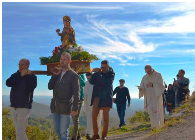
Seguint la tradició, els fidels van dur en processó la imatge de la Mare de Déu, tot cantant els Goigs del Roser de Pallerols.