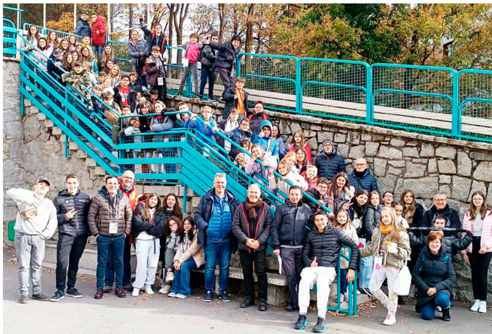
Els infants de preconfirmació de les Parròquies d'Andorra, amb els mossens i catequistes de l'Arxiprestat, van celebrar la seva trobada trimestral a l'escola Mare Janer de Santa Coloma.

zar les diferents activitats, es van trobar a la capella de l'escola per presentar el treball realitzat durant el matí i compartir un moment més de silenci per descobrir el veritable significat del Nadal.