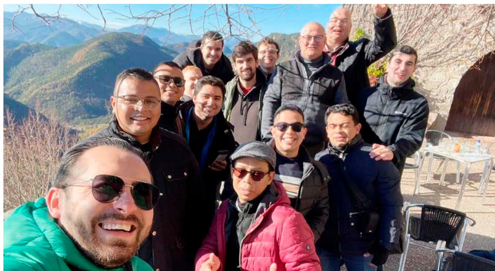
Els seminaristes del Seminari Major Interdiocesà van compartir a Gombrèn unes jornades de recés i convivències.

Diumenge dia 3 de desembre, una joirosa trobada festiva a l'església de Sant Pau del Camp de Barcelona permeté el retrobament d'un centenar llarg d'antics membres militants de la JOBAC, actualment molt presents en diverses comunitats d'Església i en