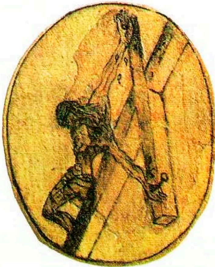
Salvador Dalí es va inspirar en aquest dibuix de Sant Joan de la Creu per pintar "El Crist de Portlligat" (a la pàgina anterior).