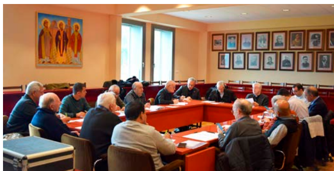
Entre d'altres temes, Consellers i Arxiprestos van reflexionar i oferir el seu parer sobre diverses qüestions relacionades amb el patrimoni diocesà, en un clima de diàleg i sinodalitat.

Tot glossant les lectures proclamades, l'Arquebisbe destacà que l'amor que ens hem tingut en aquesta vida no es marceix sinó que es transforma i es fa encara més gran, etern... De tal manera que viure és també viure amb els morts que ens han precedit, i que no han deixat d'existir sinó que han passat a una nova