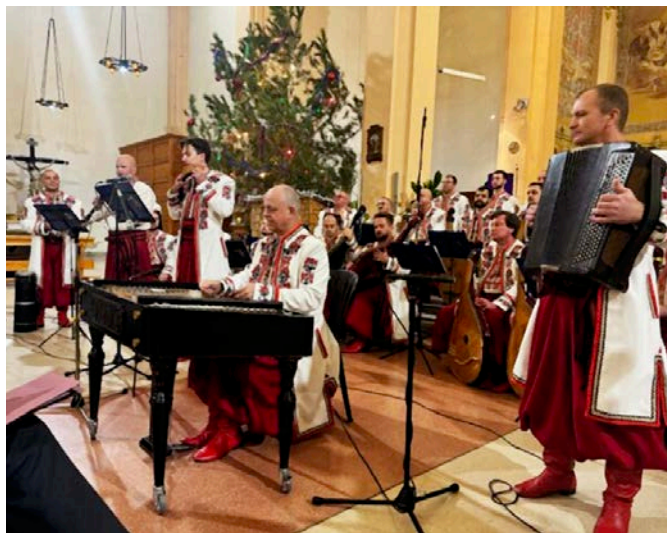
El Cor i l’Orquestra Nacional de Bandures d’Ucraïna va oferir un concert per la pau a l’església parroquial de Guissona.

Hi assistí un nombrós públic que ompli el temple parroquial, entre el qual hi eren l’Arquebisbe d’Urgell, el Rector de Guissona i el Primer Tinent d’Alcalde de l’Ajuntament, així com el sacerdot de la comunitat greco-ortodoxa, el Rector