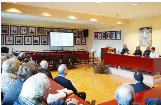
La Casa del Bisbat va acollir el 22 de desembre la tradicional felicitació nadalena de la Cúria diocesana a l'Arquebisbe d'Urgell.