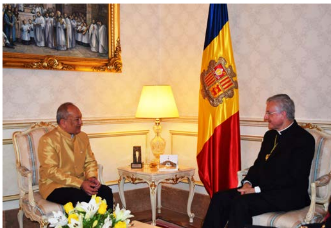
L'Arquebisbe i Copríncep, amb el nou Ambaixador de Tailàndia davant el Principat d'Andorra.