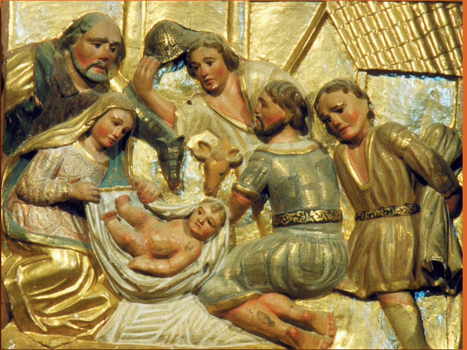
Detall del retaule del segle XVII de l'església de Santa Maria de Ginestarre (Pallars Sobirà)

"Aquest és el meu fill estimat, en qui m'he complagut" (Mateu 3,17)