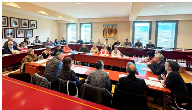
A la reunió ordinària del Consell Pastoral Diocesà d'Urgell hi assistí la pràctica totalitat dels Consellers.