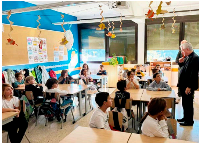
L'Arquebisbe va visitar els centres escolars dels tres sistemes educatius del Principat i va conversar amb professors i amb alumnes de tots els cursos (a dalt, amb alumnes de l'Escola Francesa; i, a sota, al col·legi Mare Janer (esquerra) i al col·legi Sant Ermengol).

primera i segona Ensenyança i de batxillerat de l'Escola Andorrana. En tots els casos, l'Arquebisbe parlà amb alumnes i professors per copsar de primera mà les inquietuds i anhels d'uns i altres, així com el pols dels sistemes educatius del Principat.